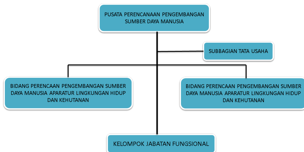
Gambar 1. Struktur Organisasi Pusrenbang SDM

Berdasarkan Peraturan Menteri Lingkungan Hidup dan Kehutanan Nomor P.15 Tahun 2021 Struktur Organisasi Pusat Perencanaan Pengembangan SDM terdiri atas 2 Eselon III, 1 Eselon IV dan Kelompok Jabatan Fungsional. Struktur Organisasi Pusat Perencanaan Pengembangan SDM secara lebih jelas digambarkan sebagaimana Gambar 1.